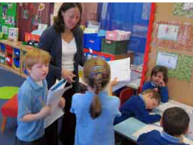
Lire et écrire sont enseignés de manière si possible ludique.