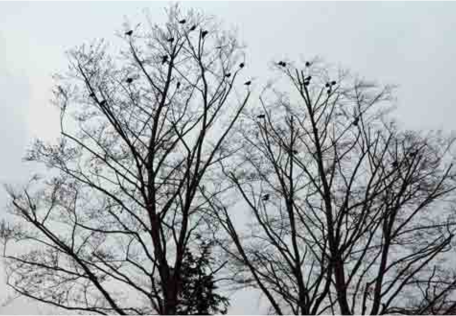
Points de vue panoramiques occupés: choucas sur des hêtres près du château de Hallwyl.

tritives indésirables provenant de l'agriculture qui parviennent à s'infiltrer; Berne souhaite de tout cœur une extension de ces zones protégées pour combattre les effets de la surfertilisation du lac qui est à peine maîtrisable, malgré les nombreuses mesures prises, en raison du faible débit.