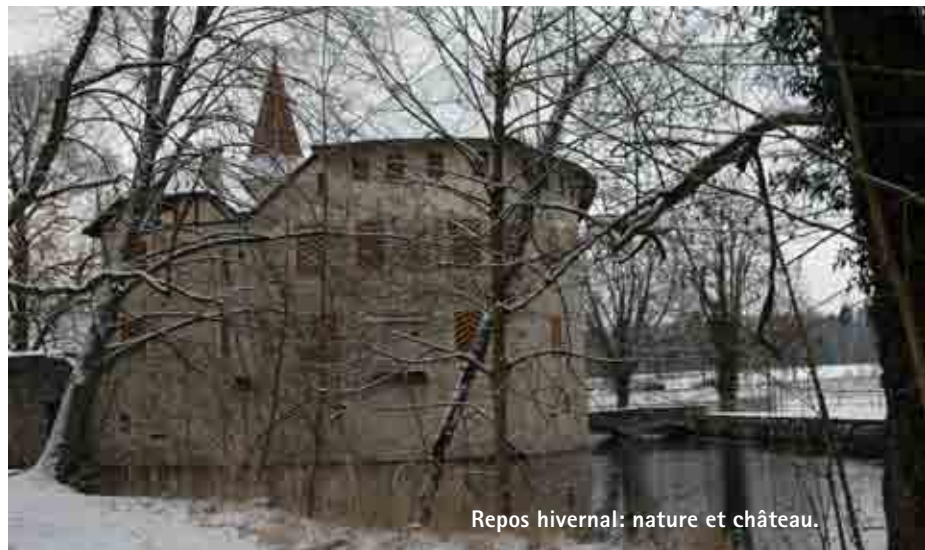
Repos hivernal: nature et château.

Cette zone humide offre effectivement de bonnes, voire idéales conditions de croissance, ce à quoi contribuent certaines substances nu- ▶