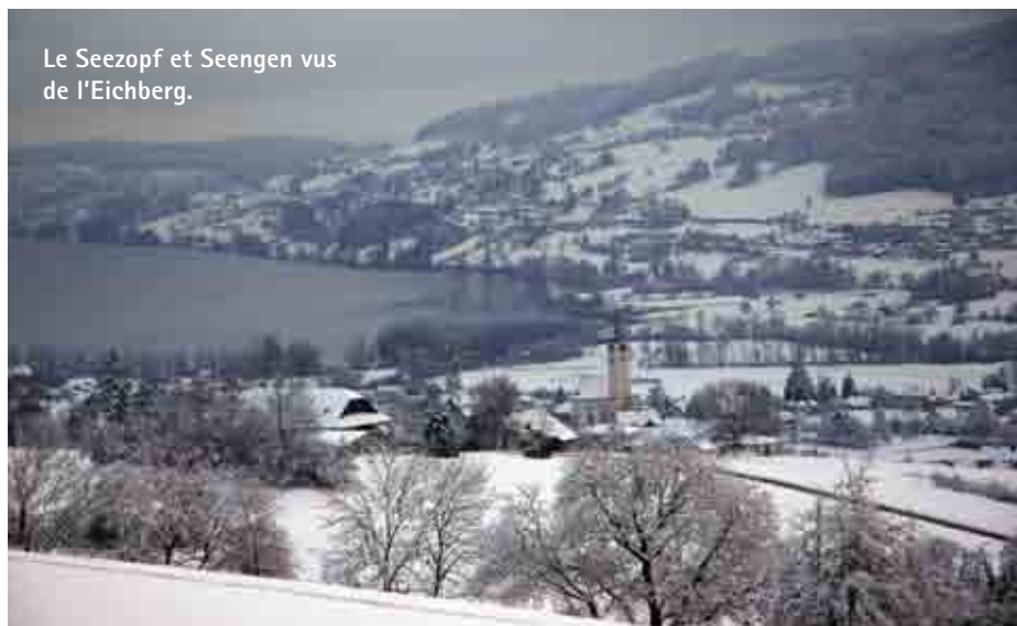
Le Seezopf et Seengen vus de l'Eichberg.

Après la démolition de l'ancienne église de Seengen vers 1920, les tombes des membres de la famille Hallwyl ont été transférées au château; c'est aussi le cas du monument à la mémoire de Hans von Hallwyl (1776–1802) et Dorothea Ustery (1765–1804). Ceux qui s'intéressent à l'histoire de cette famille trouveront des informations sur le site Internet www.ag.ch/hallwyl/de/pub/geschichte/familiengeschichte.php . On trouve ici également des éléments qui rappellent l'épouse de Walter von Hallwyl, Wilhelmina, née Kempe (1844–1930), qui créa la fondation Hallwyl et ouvrit le château au public. En 1926, elle offrit les archives familiales aux archives de l'État de Berne et, un an plus tard, les biens anciens privés de la famille Hallwyl (meubles, peintures, etc.) au Musée national suisse de Zurich (Schweizerisches Landesmuseum). La postérité lui doit donc beaucoup.