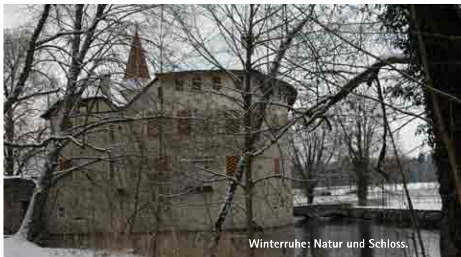
Winterruhe: Natur und Schloss.

Innert eines einzigen Jahres wuchs zum Beispiel eine Grauweide, in der gerade ein Zaunkönig herrschte, bis auf etwa 2,5 m Höhe empor. Die Heckenbildung geht schnell, wie auch an einer Versammlung von Weiden, gemeinem Schneeball (mit roten Knospen) und Kreuzdorn zu erkennen war. Waldreben (Nielen) wachsen dem Schatten davon, und der Hopfen windet sich an Bäumen dem Licht entgegen. Viele Bäume tun sich durch eine ausgesprochene Zwieselbildung (mit gegabelten Stämmen und mehrfachen Kronen) hervor, umklammern einander, wie eine Traubenkirsche, die mit einer Säulenpappel eng verschmolzen ist. Eine Umklammerung auf Dauer. ▶