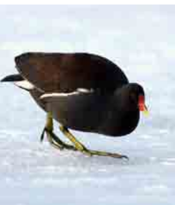
Teichhuhn am Seezopf.

Am Uferweg vom Schloss Richtung Meisterschwanden kommt man am Pfahlbauhaus mit dem kürzlich erneuerten Schilfdach vorbei, das 1989 vom Rotary-Club Lenzburg zusammen mit Max Zurbuchen, Steinzeitwerkstatt-Betreiber in Seengen, auf einem etwas labilen Fundament gebaut wurde. Eine Informationstafel ruft in Erinnerung, dass in der Stein- und Bronzezeit auch am Hallwilersee (wie an den meisten Seen des Schweizer Mittellands und der Voralpen) Menschen lebten. Wörtlich: «In der Jungsteinzeit, zwischen 5500 und 2300 v. Chr., standen in Meisterschwanden beim Erlenhölzli und vor der